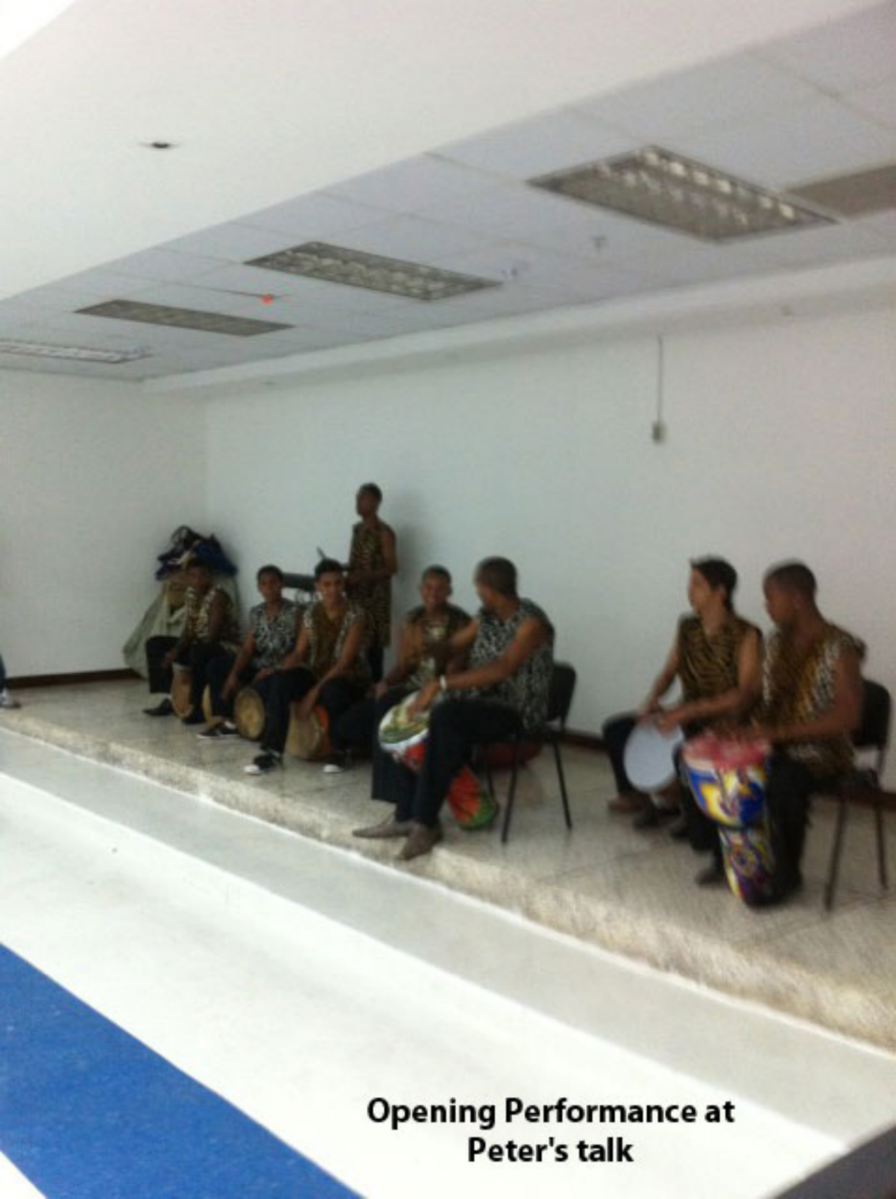
Opening Performance at Peter's talk