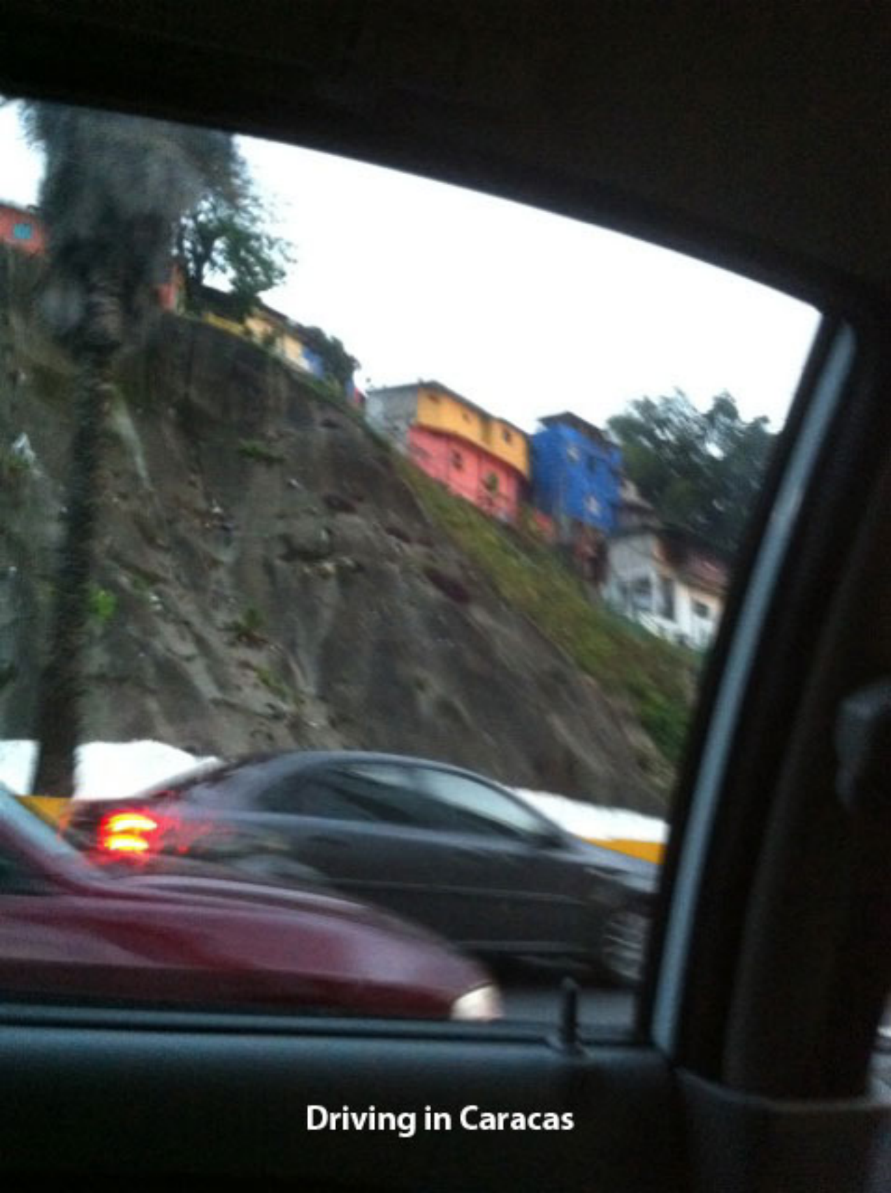
Driving in Caracas