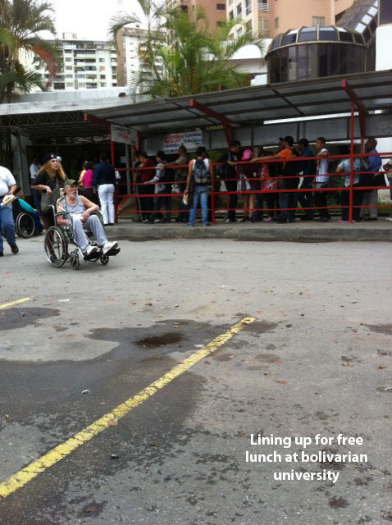
Lining up for free lunch at bolivarian university