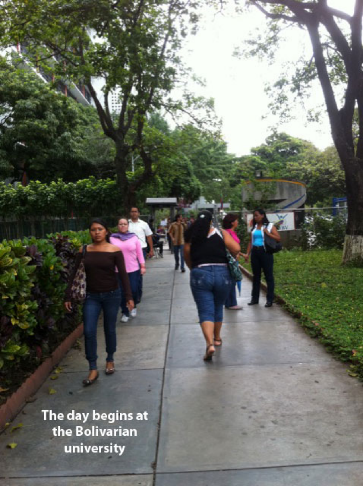
The day begins at the Bolivarian university